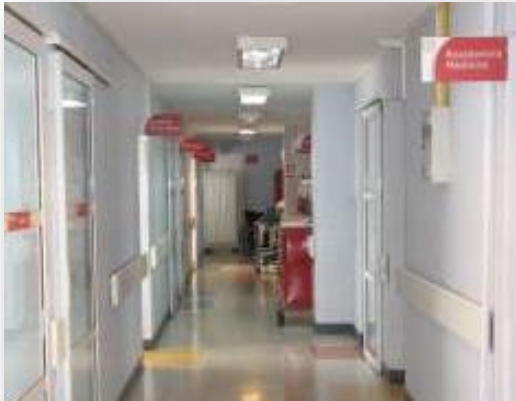
Área de Infraestructura