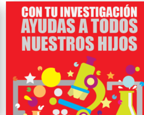
Área de Investigación