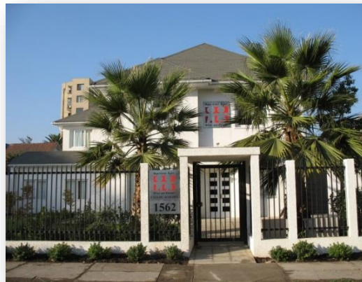
Área de Acogimiento